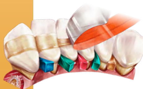
Attelles de contention - dents lâches