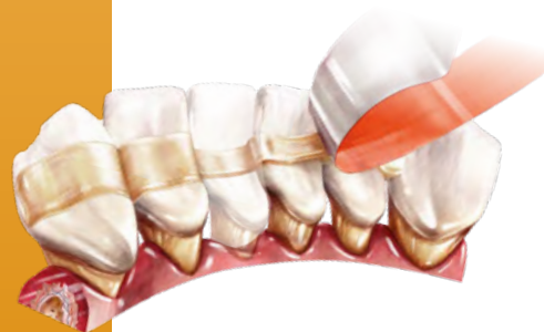
Attelle-bridge - dents lâches, une dent manquante