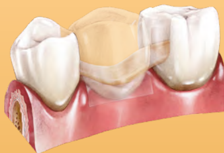
Bridge - une dent manquante, adjonction d'une dent