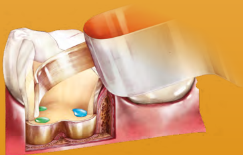
Endocouronne - destruction massive de la dent tout en maintenant une partie de la couronne, après le traitement du canal radiculaire