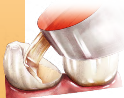
Grosse obturation dentaire, inlays/onlays - destruction importante de la couronne dentaire, sans ancrage radiculaire