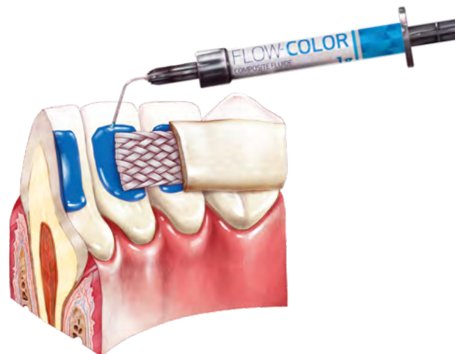
Protection de l'émail dentaire pendant le retrait d'un appareil ou d'une attelle de contention temporaire