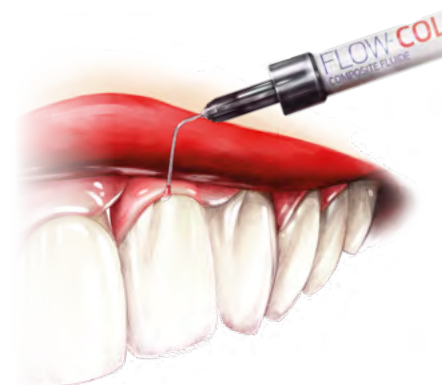
Amélioration de l'esthétique de toute restauration dentaire