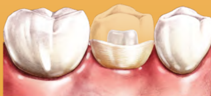
Couronne en composite sur un moignon reconstruit