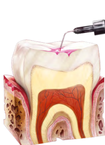
Possibilité de surveiller l'usure du produit de scellement des puits et sillons chez les enfants